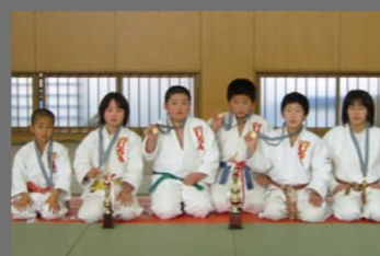
柔道・小学生団体戦の部優勝