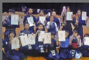
剣道・小学生の部