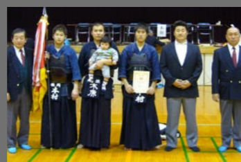
剣道・一般団体戦の部優勝