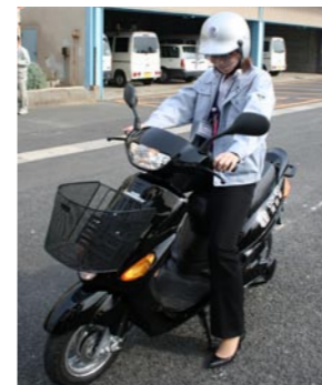
無償貸与は1年間。職員が業務で使用します

1月20日、電動スクーターの企画製造販売会社「楽しいアイスクーター」から、電動スクーターのモニター車1台が苅田町に無償貸与されました。同スクーターはガソリンを一切使用しないので排出ガスゼロ。家庭用電源で8時間充電すれば約50km〜80km走行できます。