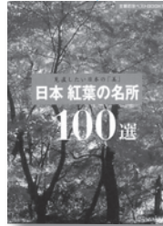
日本紅葉の名所 100 選