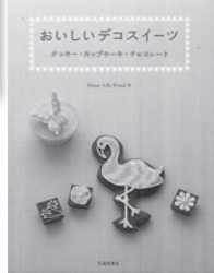
おいしいデコスーツ