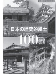
日本の歴史的風土 100 選