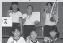
▲小学生4年以下の部