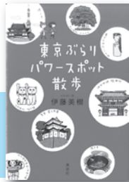
「東京ぶらり パワースポット散歩」 伊藤美樹／著 講談社