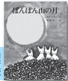
「ぼんぼん山の月」 あまんきみこ／著 文研出版