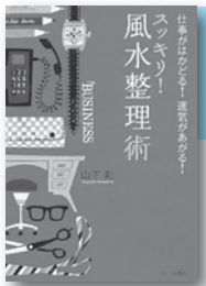
「スッキリ! 風水整理術」 山下剛／著 PHP研究所

最近パワースポットめぐりや、手相占いなど開運に注目があつまっています。2011年をハッピーに過ごしたいと思っている人におすすめな本を紹介します。風水、パワースポットガイドや一度はお参りしたい神社の本など、見ているだけでご利益があるかも!?