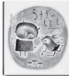
「うさぎのしるし」 ひだきょうこ／著 あかね書房

寅年すぎたら、卯年。うさぎさんの出番です。かわいくて人気のうさぎは、おはなしの中にもたくさん登場します。あかちゃんうさぎ、かわいいうさぎ、おりこううさぎ、いたずらうさぎ。わるいうさぎもいるかもしれません。どんなうさぎに出会えるかは読んでみてのおたのしみ。