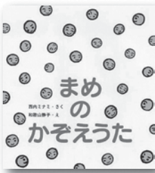
まめのかぞえうた 内ミナミ／著 ずき出版

「おにはそと！ふくはうち！」2月3日は節分です。そこで今月は、節分には欠かせない豆に注目します。豆まきでは大豆をつかいますが、えんどう豆・そら豆・グリーンピースなどなど、いろいろな豆があるものです。コロコロおまめのでてくる本が大集合！