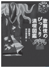
歌舞伎のびっくり満喫図鑑 野倫子／著 小学館

2月20日は歌舞伎の日です。1607年のこの日、出雲の阿国が江戸城で初めて披露したといわれる歌舞伎や、能、狂言といった世界に誇る日本の伝統美についてより深く親しんでみませんか。伝統芸能のガイド本のほか、美しい日本の着物の本もどうぞ。