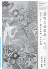
着物文様事典いろは 弓岡 勝美／編 ピエ・ブックス