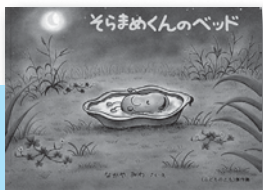
「そらまめくんのベッド」 なかやみわ／著 福音館書店