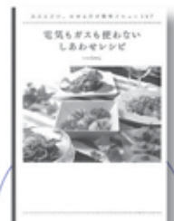
電気もガスも使わないしあわせレシピ