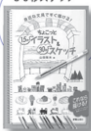
ちょこっと15秒イラスト&30秒スケッチ