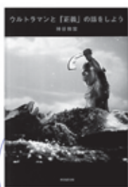
ウルトラマンと「正義」の話をしよう