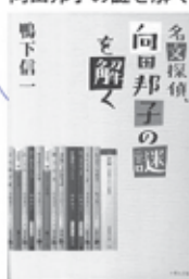
名文探偵、向田邦子の謎を解く