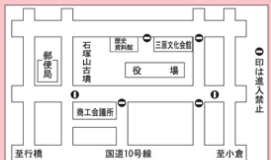
▲盆踊り大会会場周辺道路交通規制(午後6時～10時)