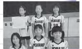
与原上トリプルサンダーズ