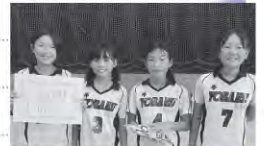
与原上ファイターズ

暑い中、13チームの子どもたちが頑張ってくれました。最初は応援の声も小さかったのですが、試合が進んでいくと大きな声の応援があり、大人と子どものよいふれあいになりました。結果は次のとおり。