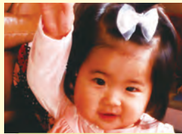
有光菜花ちゃん (20日生)

Happy Birthday まうちゃん！ ふうき兄ちゃんと、たくましく育ってネ♡ 歩けるの楽しみにしてまあすう。