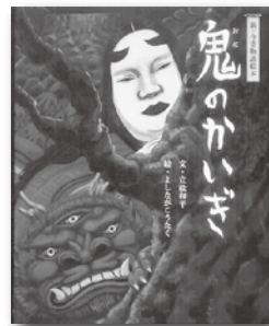
「鬼のかいぎ」 立松和平／著 新樹社