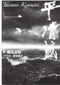
「平清盛 1」 藤本有紀／著 NHK出版

今年の大河ドラマは、平清盛です。平安時代と聞くと、十二単や源氏物語など、きらびやかな貴族のイメージですが、今回は戦いやよらいなどの武士の世界が舞台です。ドラマがより楽しめる平清盛の人物像や時代背景がわかる本を集めています。