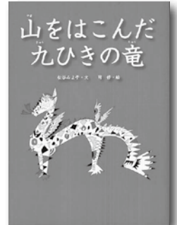
「山をはこんだ九ひきの竜」 松谷みよ子／著 佼成出版社

今年の子支は、辰です。そこで、辰や竜をはじめ、鬼・かっぱ・てんぐなど日本の伝説の生き物が出てくるおはなしを集めました。何だかこわくて強そうですが、いったいどんな生き物なのでしょう…。ぜひ、読んでみてください。