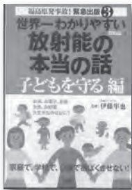
「世界一わかりやすい放射能の本当の話 子どもを守る編～福島原発事故！緊急出版3～」 宝島社