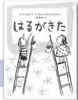
「はるがきた」 ジーン・ジオン／著 主婦の友社