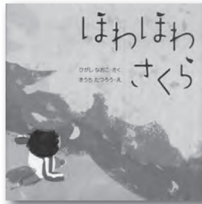
「ほわほわさくら」 東直子／著 くもん出版