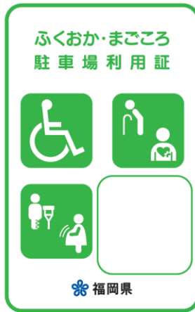
緑色 (身体・知的・精神障がいのある方、高齢者、難病者)

赤色の利用証は、車椅子常時利用の身体障がいのある方で、自ら運転する方に交付しています。幅の広い駐車場が必要な方となりますので、ご配慮をお願いします。