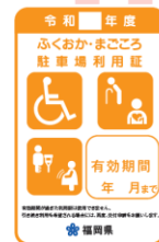
オレンジ色 (妊産婦、けが人)