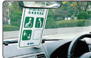
利用証をルームミラーに掛けて使用します