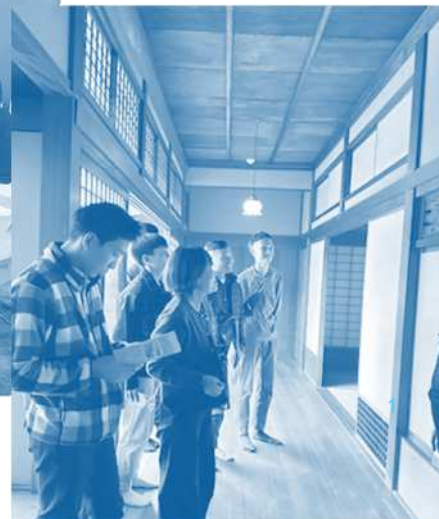
令和7年度 事業の様子 ワールド運動会・日本語教室・バスハイク