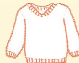
●ニットセーター類