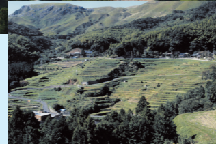
等覚寺地区の棚田