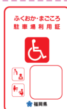
赤色（車椅子常時利用の身障者で自ら運転）