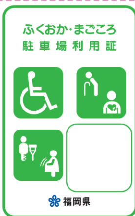
緑色（身体・知的・精神障がいのある方、高齢者、難病者）

赤色の利用証は、車椅子常時利用の身体障がいのある方で、自ら運転する方に交付しています。幅の広い駐車場が必要な方となりますので、ご配慮をお願いします。