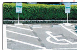
目印ステッカーが掲示してあるスペースで利用できます