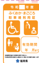
オレンジ色（妊産婦、けが人）