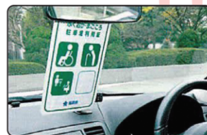
利用証をルームミラーに掛けて使用します